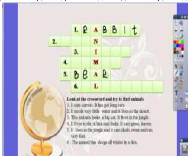
Рисунок 2 – Флипчарт-задание (10 pt)

Текст доклада Текст доклада Текст доклада Текст доклада Текст доклада Текст доклада Текст доклада Текст доклада Текст доклада. (14 pt)